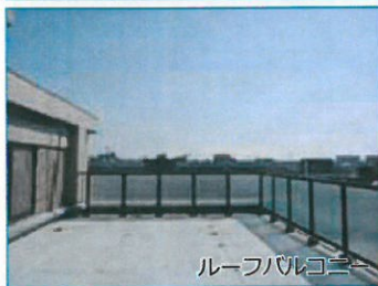
ルーフバルコニー